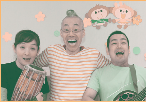
〈中央のさわむらしげはるさん以外のメンバーは変更の場合があります〉

・ぞーさんだぞ〜 ・私にできること ・ともだちのうた ・ありがとうはまほうのことば